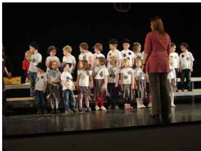
Pevski zbor Muzikalčki

»Sanje v našem vrtcu« so postale kar tradicija našega vrtca, to je posebna noč, ko otroci in zaposleni prepijo v vrtcu brez staršev. Rdeča nit letošnjega druženja je bil ples, zaspali pa smo v duhu pravljice o Pepelki. S pevskim zborom Muzikalčki smo se letos prvič udeležili območne revije pevskih zborov, kjer smo skupaj združili kar 22 otroških glasov.