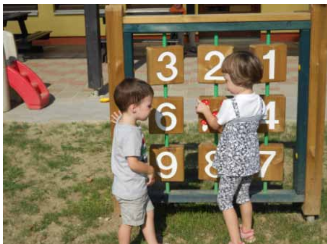
Zadovoljstvo otrok na obnovljenem igrišču

Ponosni smo, da je v začetku novega šolskega leta otroke pričakalo obnovljeno igrišče z novimi igrali, ki imajo za otroke ne samo motivacijsko, ampak tudi veliko didaktično vrednost. Z veseljem opažamo, da so nova igrala otrokom pisana na kožo, saj omogočajo doživljajne ugodja med gibanjem na prostem, skupno druženje otrok med igro in nasploh razvijajo vedoželjnost in ustvarjalnost otrok. Ob tej priložnosti bi se radi iskreno zahvalili vsem, ki ste na kateri koli način pomagali pri obnovi našega igrišča in s tem pričarali veselje in nasmeh na obrazu naših otrok.