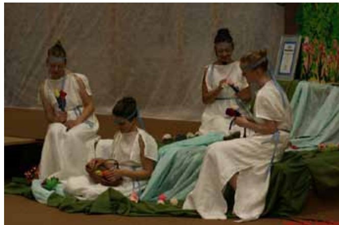
Pozdrav Evropi v telovadnici OŠ Franceta Prešerna Črenšovci

V torek je OŠ Franceta Prešerna Črenšovci pripravila prireditev Pozdrav Evropi, na kateri so učenci domače in gostujočih osnovnih šol iz Pomurja predstavili kulturo narodov posameznih evropskih držav. Posnetek o prireditvi je bil predvajan na TV Idea.