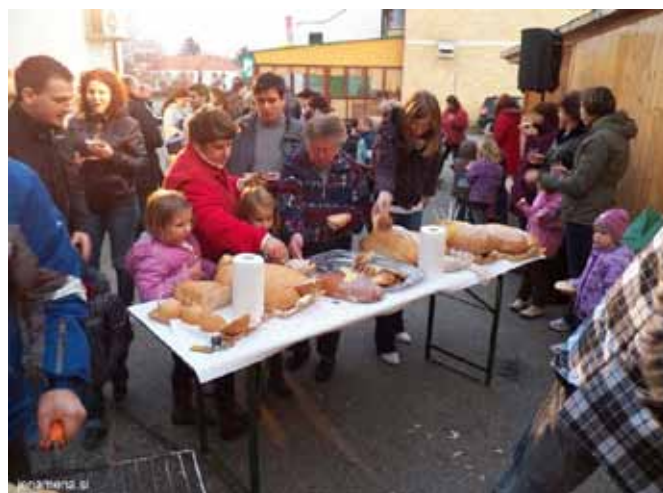
Po večeraj v Črenšovcaj (kresovanje, pri kukorčnjaki, martinovanje)

Kot vsako leto je tudi letos bilo Kulturno-turistično društvo Črenšovci soorganizator območnih srečanj, ki jih organizira JSKD OI Lendava. Tako smo pomagali pri organizaciji območnega srečanja gledaliških skupin Teater postavimo in srečanja pevcev ljudskih pesmi in godcev ljudskih viz Pozdravljam te cvetoči maj. Izjemno