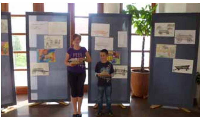
Na 2. občinskem prazniku je naše KD prejelo občinsko nagrado. Zahvaljujemo se vsem, ki ste opazili dolgoletno delo našega društva.