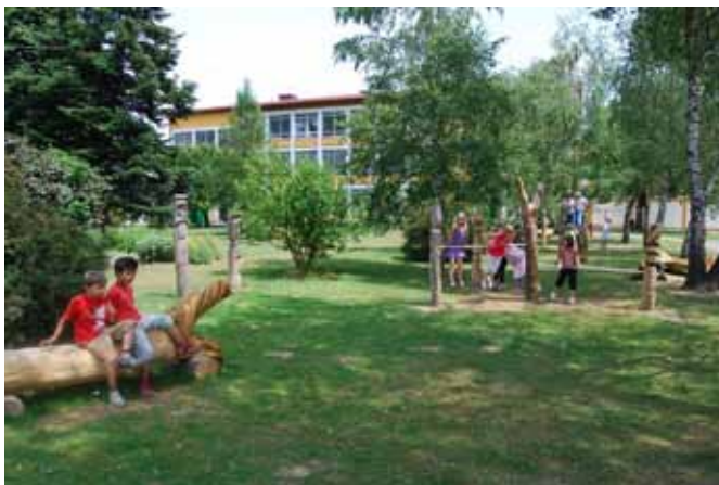
Učenci se radi igrajo na ličnih igralih, ki so jih izdelali udeleženci 3. mednarodne kiparske kolonije

Organizirali in izvedli smo 3. mednarodno kiparsko in slikarsko kolonijo z umetniki iz Slovenije, Slovaške, Madžarske in Hrvaške na temo Od negda smo tu veseli lidje. Udeleženci kiparske kolonije so izdelali umetniška igrala, ki krasijo naš park, učencem pa omogočajo rekreacijo v prostem času.