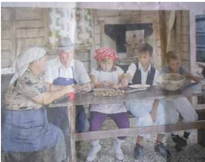
JENAMENA FEST V Črenšovcih: