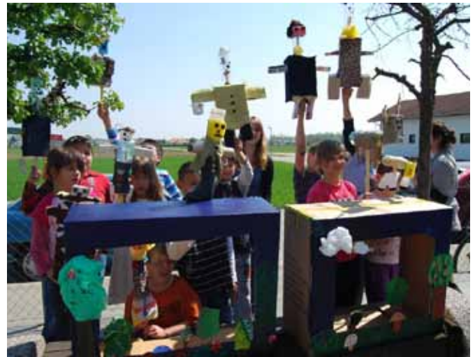
Študenti likovnega oddelka PEF iz Maribora so na kulturnem dnevu ustvarjali skupaj z učenci

vzgojo, ki je na celostnem kulturnem dnevu šole izvedel praktične nastope študentov na temo ustvarjanje iz odpadnega materiala.