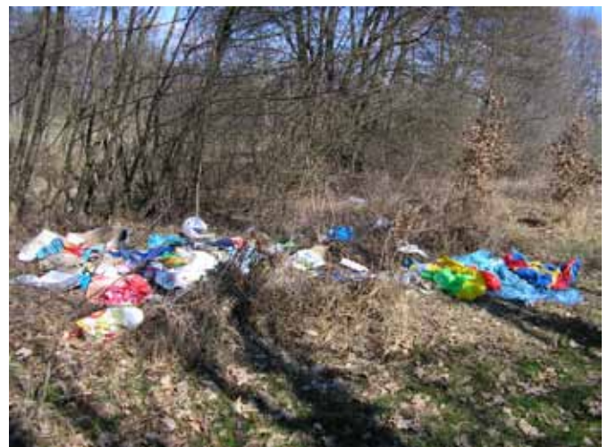
ODVRŽENI KOMUNALNI ODPADKI V NARAVO