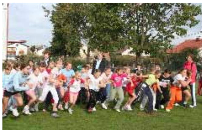
Gibanje v okviru Zdrave šole