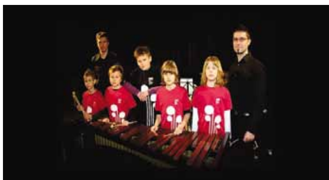
Gledališko-koncertni abonma je zahteven, a odličen projekt

V sklopu prireditev Po večeraj v Črenšovcaj smo skozi leto organizirali več prireditev (kresovanje, pravljice pod brezami, poezija pod brezami, druženje pri kukorčnjaki, martinovanje, v predprazničnem času pa načrtujemo še jelkovanje). Prireditve želijo k druženju spodbuditi predvsem krajanje, občane, ki si želijo vzeti uro