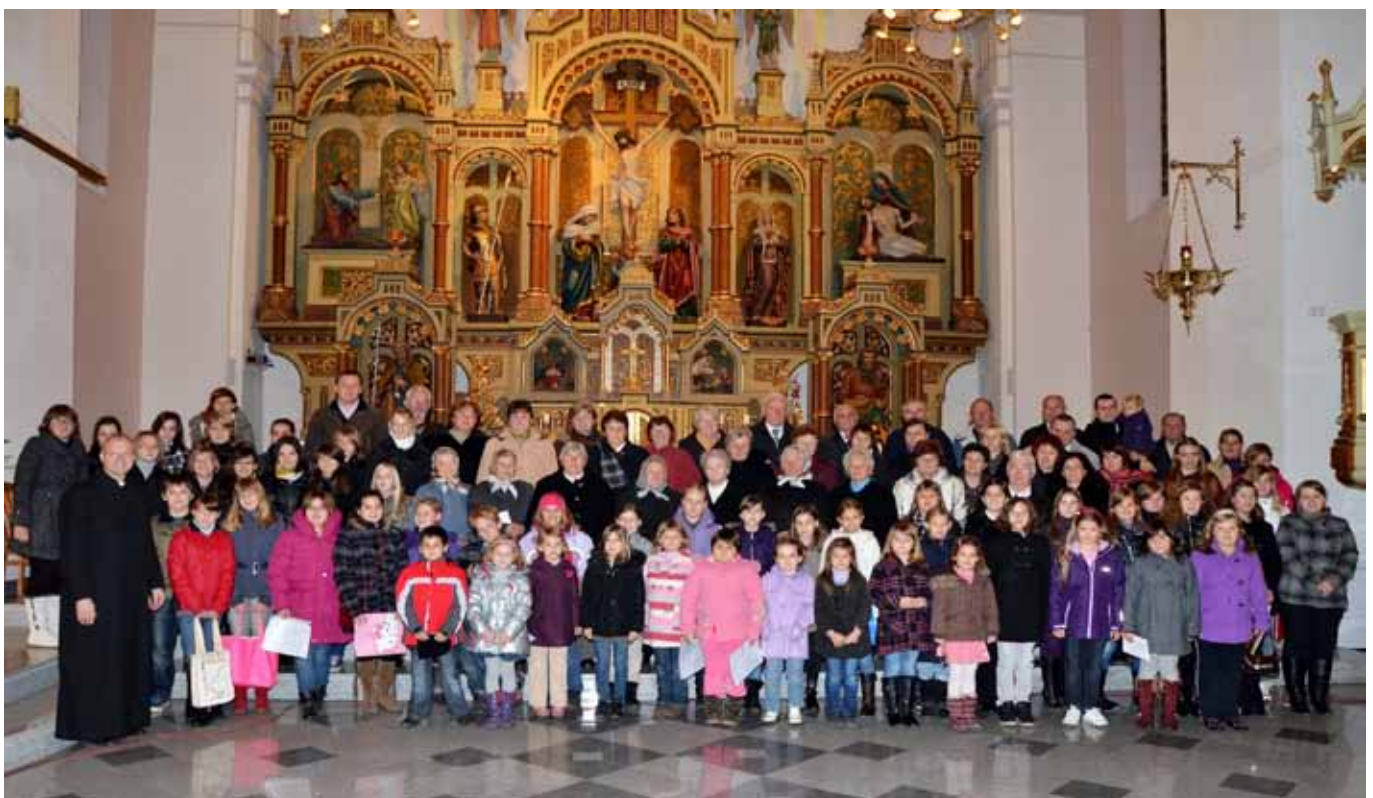
Skupinska fotografija s srečanja pevcev domače župnije ob praznovanju Sv. Cecilije v Črenšovcih 2012

Zbor vodita zborovodkinja Katja Kovač in organist