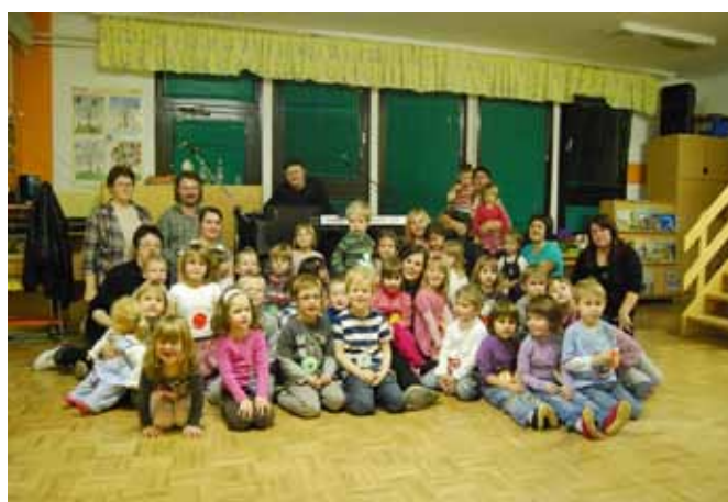
Moje sanje v vrtcu