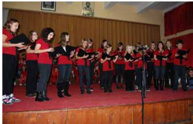
Ob dnevu šole Vuka Karadžiča v Surčinu so zadonele slovenske narodne in ljudske pesmi

Tudi v šolskem letu 2010/2011 nam je uspelo ponovno pridobiti naziv raziskovalna šola, zdrava šola in eko šola.