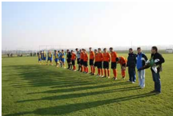
Prizor s tekme Virs Bistrica - Beltinci

Vizija nogometnega kluba Virs Bistrica je jasna: dostojno zastopati klub in vas Bistrica v pomurskem nogometnem prostoru, obenem pa črpati kader iz lastnega mladinskega pogona. To predvsem pomeni dobro delo z mladimi in v letošnjem letu smo naredili velik korak v tej smeri. To pomeni tudi veliko dela in dobro organizacijo kluba, zato je vsaka pomoč s strani katerega koli posameznika zelo dobrodošla.