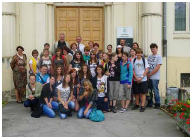
Obisk župana z gosti