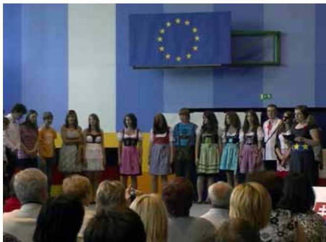
Utrinki projekta Comenius skupna zaključna prireditev

mednarodnim sodelovanjem s šolami v Avstriji, Nemčiji, Slovaški in Poljski omogočili učencem učenje tujih jezikov ter z mobilnostjo v imenovane države dali učencem priložnost za izkušnjsko učenje. Zaključek dvoletnega mednarodnega projekta je bil v mesecu juniju za vse vključene države pri nas na Bistrici. Pri tem je bila pomoč posameznih staršev resnično velika, zato hvala vsem tistim, ki ste nam pri tem pomagali.