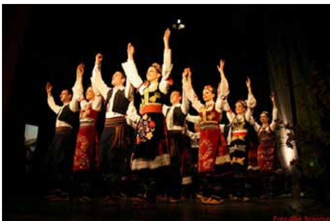
Folklorna skupina Diogen iz Surčina

Sobotno dopoldansko dogajanje je potekalo v smislu