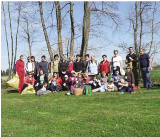
Zaključek očiščevalne akcije 2011

Občina Črenšovci je v aprilu organizirala očiščevalno akcijo. Udeležba vaščanov iz naše vasi je bila dobra, saj se je akcije udeležilo 76 vaščanov. Da bi odpravili nepravilnosti, ki so se doslej dogajale ob koriščenju vaško gasilskega doma ter z željo po skrbnem ravnanju z družbenim imetjem, smo izdelali Pravilnik o koriščenju vaško gasilskega doma Žižki. V zadnjem mesecu pa smo usme-