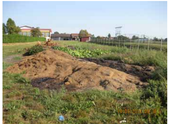
NEPRAVILNO RAVNANJE Z ZELENIM VRTNIM ODPADOM

površin z gradbenimi odpadki in nevzdrževanimi kmezijskimi zemljišči, kar smo v skladu s 65. členom Zakona o splošnem upravnem postopku odstopili v reševanje pristojnim inšpekcijskim službam.