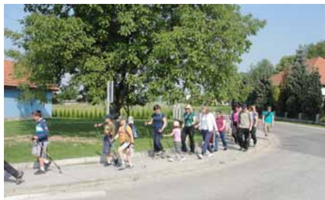
Pohod treh generacij