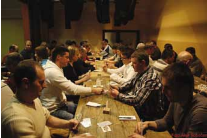
Ulično tekmovanje v šnopsu