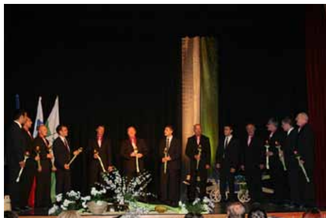
Moški vokalni kvintet Aeternum in Oktet Belmura na koncertnem večeru

V sredo je v kulturni dvorani v Črenšovci potekal glasbeni večer pod naslovom Od negda veseli, na katerem so z ubranim petjem nastopili člani Moškega vokalnega kvinteta Aeternum in člani Okteta Belmura.