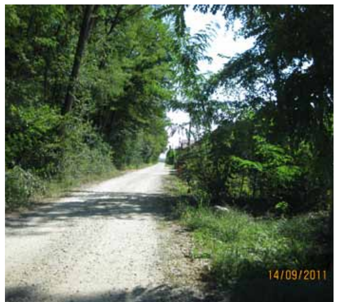
OVIRE V VAROVALNEM PASU CESTE