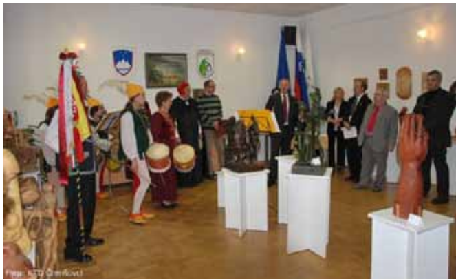
Otvoritev mednarodne razstave rezbarskih izdelkov in izdelkov iz lesa