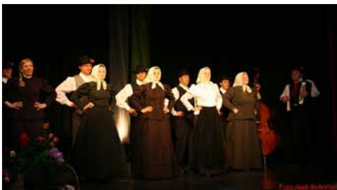
Folklorna skupina KTD Črenšovci v novih folklornih oblekah