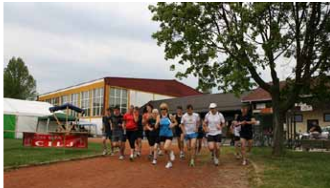
Start na Mura krosu 2011

športa in rekreacije, saj je bil v sodelovanju s Športnim društvom Črenšovci organiziran Pohod za mürski cvejt, OŠ Franceta Prešerna Črenšovci je za učence in starše pripravila krajši pohod, društvo Etno pa je organiziralo že tradicionalni kros, na katerem so se lahko pomerili domači in gostujoči tekači. Razglasili so tudi rezultate natečaja, v okviru katerega so izbirali najboljši poster, ki bo tek Mura kros vizualno napovedoval prihodnje leto.