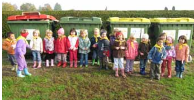
Na ekološkem otoku

V tem šolskem letu smo v Vrtcu Črenšovci uspešno izvedli zaključni korak za pridobitev naziva eko vrtec , ki gradi vrednote za odgovoren način našega bivanja na tem planetu. Na slavnostni prireditvi, 18. 11. 2010, smo podpisali eko listino , s katero smo se zavezali, da kot poje eko himna vrtca Črenšovci, »... eko otroci poskrbimo, da nam na Zemlji lepše bo!« Prireditev je potekala v šolski telovadnici, ob prisotnosti gospoda župana, predstavnice Eko šole, vseh zaposlenih, staršev, otrok ter okoliških eko koordinatorjev. Priznajmo si, da se odrasli lahko marsičesa naučimo od otrok ravno na tem področju.