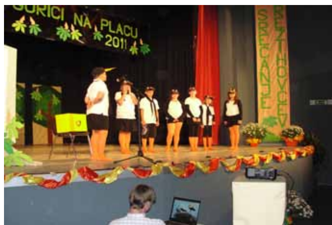
Srečanje Prežihovih šol

V mesecu maju smo se udeležili dvodnevne srečanja Prežihovih šol, ki se je odvijalo v Dolini (Italiji), na šoli smo organizirali tudi pohod treh generacij in v poletnem času izvedli eko športni tabor. V poletnih mesecih smo bili aktivni pri obnovi otroškega igrišča pri vrtcu ter funkcionalni preureditvi prostora zbornice za delo strokovnih delavcev šole. V šolo 21. stoletja vse bolj prodira virtualni način dela z učenci, zato strokovni delavci veliko časa namenimo e-izobraževanju. Postati želimo e-kompetenčna šola, ki bo znala učencem ponuditi znanje na način, ki je njim blizu.