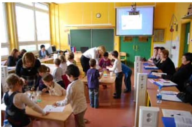
Predstavili smo se na mednarodnem posvetu

Organizirali smo različne oblike sodelovanja s starši, babicami in dedki, saj le-ti s svojim obiskom še posebej obogatijo življenje v vrtcu.