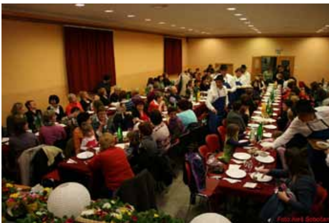
Praznovanje dneva žena 2011