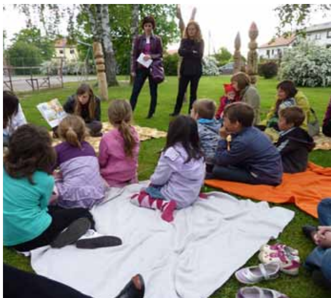
Otroci in starši ob poslušanju pravljič pod brezami

V ponedeljek je v Krajevni knjižnici Črenšovci bila organizirana knjižnična ura Pelji me v knjižnico, sposodiva si pravljico, o kateri je bil objavljen tudi članek v časopisu Večer. V šolskem parku je potekala pravljicična ura Pravljičice pod brezami in delavnice za otroke in prireditev Poezije pod brezami, na kateri je bila predstavljena avtorska poezija občanov in občank. Na prireditvi so sodelovali člani društva Štrk, učenci OŠ Franceta Prešerna Črenšovci, recitatorji in ljudske pevke Kulturno-turističnega društva Črenšovci.