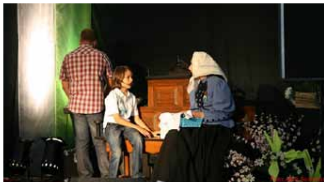
Osrednja prireditev Od negda smo tü veseli lidje

Zvečer je na osrednjem prireditvenem prostoru v športnem parku v Črenšovcih potekala osrednja prireditev z naslovom Od negda smo tü veseli lidje , na kateri so sodelovali učenci OŠ Prežihovega Voranca in učenci OŠ Franceta Prešerna Črenšovci, člani Kulturno-turističnega društva Črenšovci, Ženska vokalna skupina Evterpe in člani romskega kulturnega društva Romano Pejtaušago. Prireditev je bila posebej slavnostna tudi zaradi prisotnosti gasilcev vseh prostovoljnih gasilskih društev Občine Črenšovci.