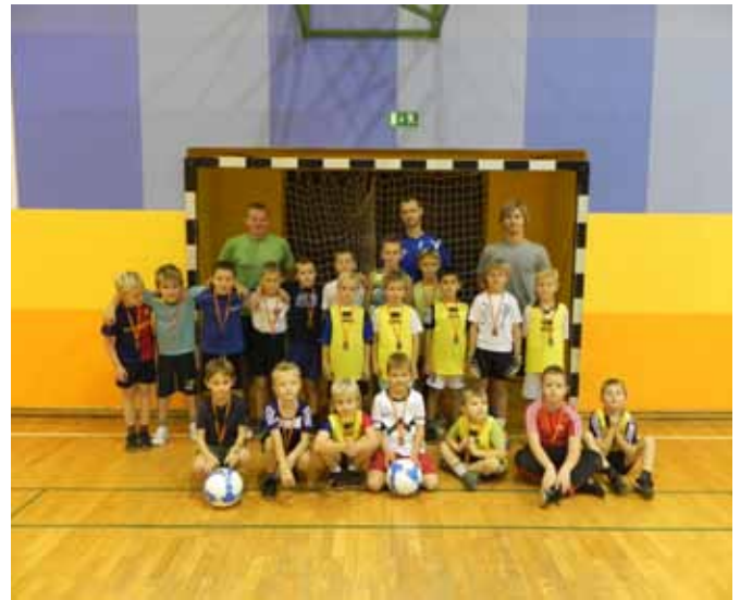
Turnir v tekmovalju Rad igram nogomet

ki je dosegel kar 33 golov. Pri selekciji U-14 smo zaradi premajhnega števila lastnih igralcev sodelovali z NK Črenšovci.