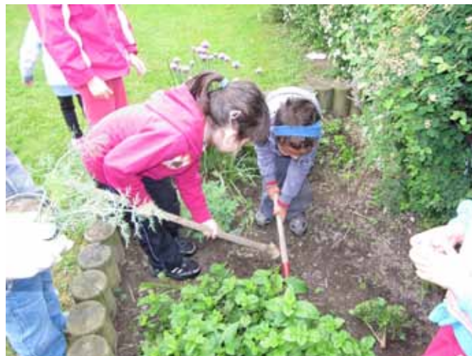
Urejamo gredico z zdravilnimi zelišči

ter dekoracije jedi za otroke. Na tem področju smo izvajali dejavnosti v projektih Zdravje v vrtcu in Varo s soncem.