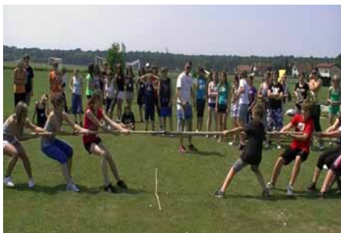
Športna olimpijada na šolskem dvorišču

V mesecu maju smo se udeležili dvodnevne srečanja Prežihovih šol, ki se je odvijalo v Dolini (Italiji), na šoli smo organizirali tudi pohod treh generacij in v poletnem času izvedli eko športni tabor. V poletnih mesecih smo bili aktivni pri obnovi otroškega igrišča pri vrtcu ter funkcionalni preureditvi prostora zbornice za delo strokovnih delavcev šole. V šolo 21. stoletja vse bolj prodira virtualni način dela z učenci, zato strokovni delavci veliko časa namenimo e-izobraževanju. Postati želimo e-kompetenčna šola, ki bo znala učencem ponuditi znanje na način, ki je njim blizu.