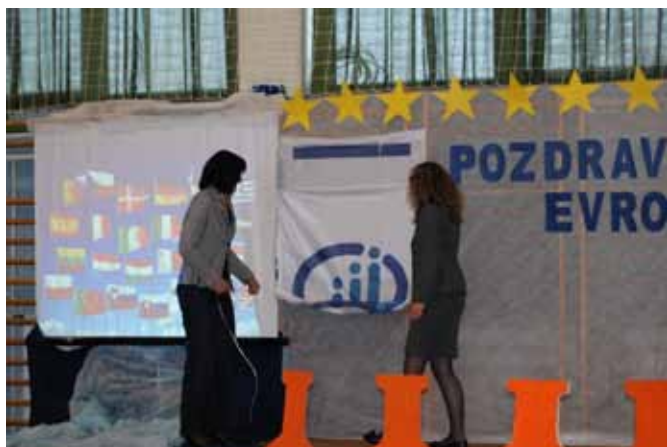
Podelitev certifikata kakovosti – Kakovost za prihodnost vzgoje in izobraževanja, 9. maj 2011

Učencem naše šole je bilo omogočeno sodelovanje na številnih natečajih, prireditvah, srečanjih in razpisih, od šolske do mednarodne ravni. Na tovrstnih prireditvah je sodelovalo 1.332 učencev, za svoje delo pa so bili nagrajeni s številnimi priznanji, pohvalami, diplomami in nagradami.