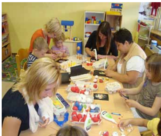
Druženje s starši

Pred poletnimi počitnicami smo šol. leto zaključili s skupnim izletom na ekološko kmetijo Čebelji gradič na Goričkem, konec junija pa so novim učenostim na protis prireditvijo pripravili mini maturante.