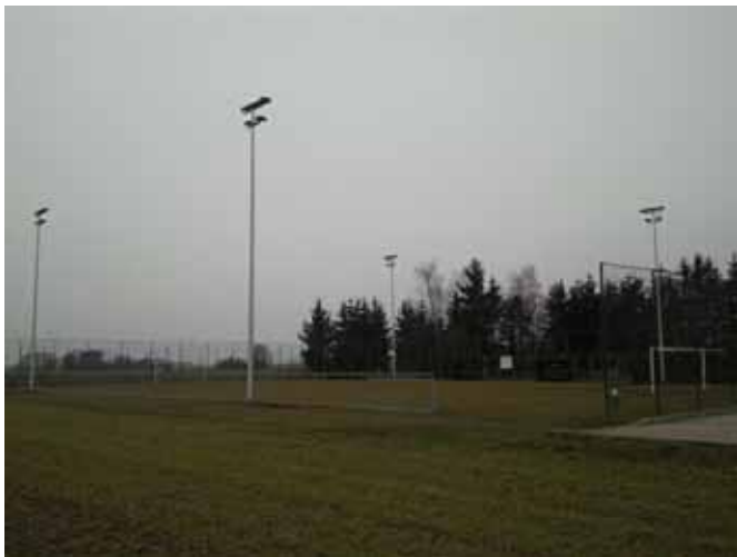
Igrišče za mali nogomet je v letu 2011 dobilo sodobno razsvetljavo