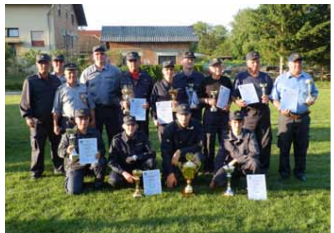
Nekaj dodatno izpostavljenih aktivnosti po posameznih društvih