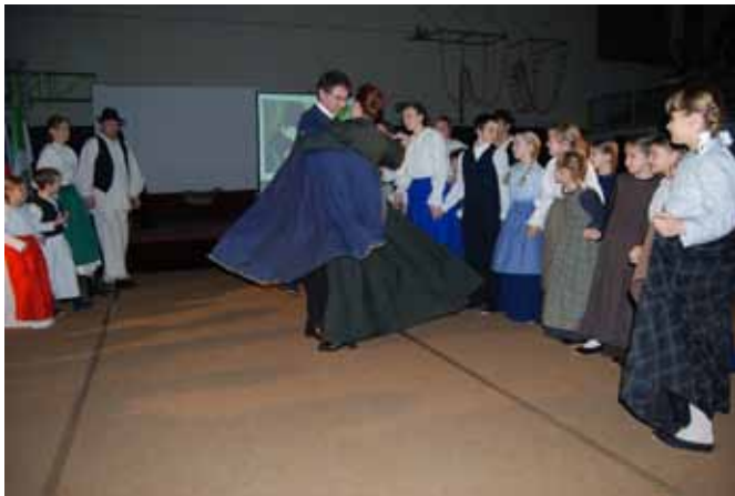
Sodelovanje učencev in članov KD Črenšovci ob slovenskem kulturnem prazniku

Prešernovih šol na temo domače obrti, območno srečanje gledaliških skupin, na regijski ravni smo organizirali Festival talentov, v okviru projekta Didaktika ocenjevanja znanja smo bili osrednja šola za Pomurje in Prlekijo.